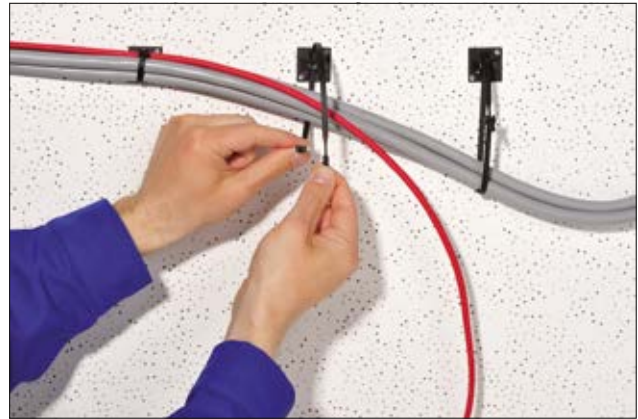
Q-tie Kabelbinder mit Vorverriegelung ermöglichen eine temporäre und finale Kabelbündelung mit nur einem Kabelbinder.