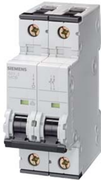
LEITUNGSSCHUTZSCHALTER 230V 10KA, 1+N-POLIG, C, 4A, T=70MM