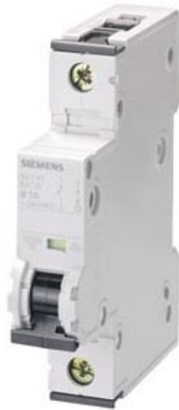
LEITUNGSSCHUTZSCHALTER 230/400V 10KA, 1-POLIG, B, 6A, T=70MM