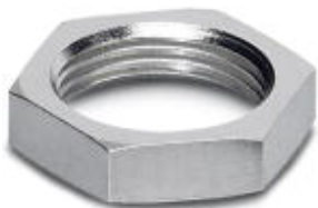
Flachmutter mit M8-Gewinde

Bitte beachten Sie, dass die hier angegebenen Daten dem Online-Katalog entnommen sind. Die vollständigen Informationen und Daten entnehmen Sie bitte der Anwenderdokumentation. Es gelten die Allgemeinen Nutzungsbedingungen für Internet-Downloads. ( http://phoenixcontact.de/download )