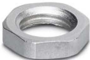
Flachmutter mit M5-Gewinde

Bitte beachten Sie, dass die hier angegebenen Daten dem Online-Katalog entnommen sind. Die vollständigen Informationen und Daten entnehmen Sie bitte der Anwenderdokumentation. Es gelten die Allgemeinen Nutzungsbedingungen für Internet-Downloads. ( http://phoenixcontact.de/download )