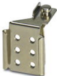
Schraubenhalter, zum Aufbewahren von max. 6 Schaltschrauben der ISSB 10-8

Bitte beachten Sie, dass die hier angegebenen Daten dem Online-Katalog entnommen sind. Die vollständigen Informationen und Daten entnehmen Sie bitte der Anwenderdokumentation. Es gelten die Allgemeinen Nutzungsbedingungen für Internet-Downloads. ( http://phoenixcontact.de/download )