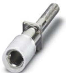
Prüfsteckerbuchse, Farbe: weiß

Bitte beachten Sie, dass die hier angegebenen Daten dem Online-Katalog entnommen sind. Die vollständigen Informationen und Daten entnehmen Sie bitte der Anwenderdokumentation. Es gelten die Allgemeinen Nutzungsbedingungen für Internet-Downloads. ( http://phoenixcontact.de/download )