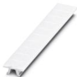
Zackband, 10-teilig, längs bedruckt mit den fortlaufenden Zahlen: 111 ... 120, weiß, Breite: 6 mm

Bitte beachten Sie, dass die hier angegebenen Daten dem Online-Katalog entnommen sind. Die vollständigen Informationen und Daten entnehmen Sie bitte der Anwenderdokumentation. Es gelten die Allgemeinen Nutzungsbedingungen für Internet-Downloads. ( http://phoenixcontact.de/download )