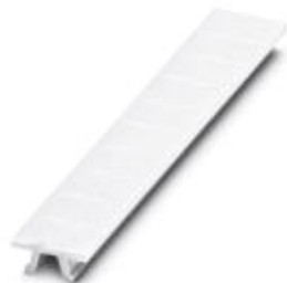
Zackband, 10-teilig, längs bedruckt mit den fortlaufenden Zahlen: 191 ... 200, weiß, Breite: 6 mm

Bitte beachten Sie, dass die hier angegebenen Daten dem Online-Katalog entnommen sind. Die vollständigen Informationen und Daten entnehmen Sie bitte der Anwenderdokumentation. Es gelten die Allgemeinen Nutzungsbedingungen für Internet-Downloads. ( http://phoenixcontact.de/download )