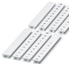
Zackband, 10-teilig, längs bedruckt mit den fortlaufenden Zahlen: 61 ... 70, weiß, Breite: 8 mm

Bitte beachten Sie, dass die hier angegebenen Daten dem Online-Katalog entnommen sind. Die vollständigen Informationen und Daten entnehmen Sie bitte der Anwenderdokumentation. Es gelten die Allgemeinen Nutzungsbedingungen für Internet-Downloads. ( http://phoenixcontact.de/download )