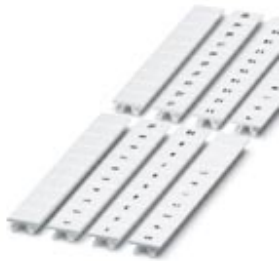
Zackband, 10-teilig, längs bedruckt mit den fortlaufenden Zahlen: 81 ... 90, weiß, Breite: 8 mm

Bitte beachten Sie, dass die hier angegebenen Daten dem Online-Katalog entnommen sind. Die vollständigen Informationen und Daten entnehmen Sie bitte der Anwenderdokumentation. Es gelten die Allgemeinen Nutzungsbedingungen für Internet-Downloads. ( http://phoenixcontact.de/download )