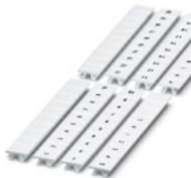
Zackband, 10-teilig, quer bedruckt mit den fortlaufenden Zahlen: 21 ... 30, weiß, Breite: 8 mm

Bitte beachten Sie, dass die hier angegebenen Daten dem Online-Katalog entnommen sind. Die vollständigen Informationen und Daten entnehmen Sie bitte der Anwenderdokumentation. Es gelten die Allgemeinen Nutzungsbedingungen für Internet-Downloads. ( http://phoenixcontact.de/download )