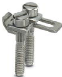
Schaltbrücke, Rastermaß: 8,2 mm, Polzahl: 2, Farbe: silberfarben

Bitte beachten Sie, dass die hier angegebenen Daten dem Online-Katalog entnommen sind. Die vollständigen Informationen und Daten entnehmen Sie bitte der Anwenderdokumentation. Es gelten die Allgemeinen Nutzungsbedingungen für Internet-Downloads. ( http://phoenixcontact.de/download )