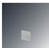
Abschlussdeckel, Länge: 28 mm, Breite: 1 mm, Höhe: 26,2 mm, Farbe: grau