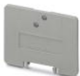
Abteilungstrennplatte, Länge: 42,5 mm, Breite: 2,5 mm, Höhe: 30,5 mm, Farbe: grau

Abteilungstrennplatte - ATP-MBK - 1413227