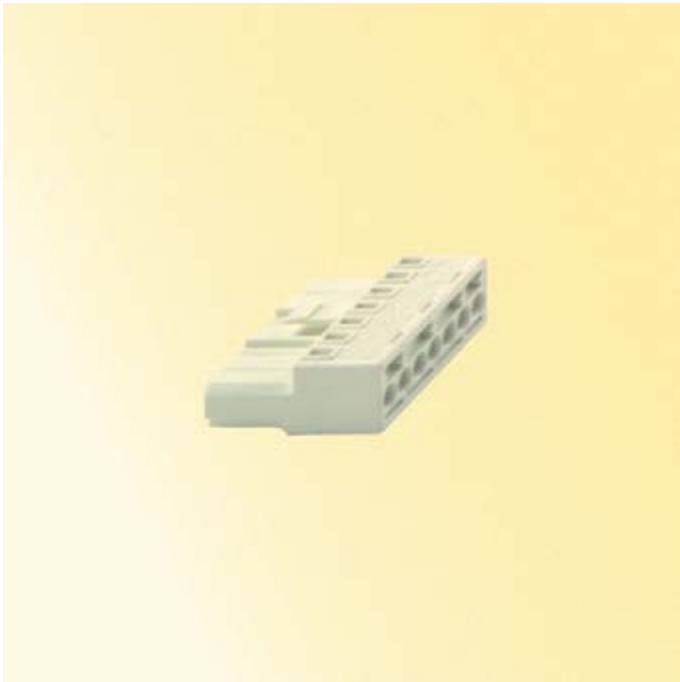
Gehäuse: Einspeiseadapter, Stecker männlich